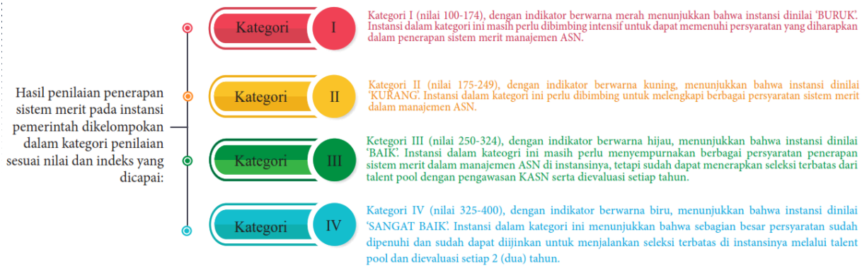
Gambar 3. Kategori Hasil Penilaian Sistem Merit dalam Manajemen ASN di Instansi Pemerintah