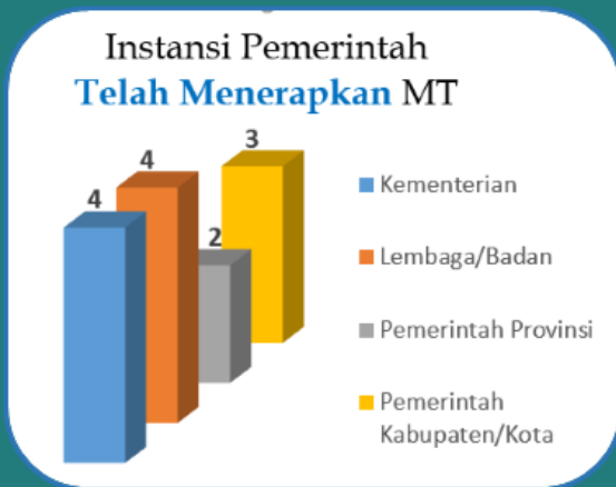
Gambar 1. Data Instansi Pemerintah yang termasuk Kategori Telah dan Siap Menerapkan Manajemen Talenta

Dari hasil penilaian yang dipublikasikan melalui portal resmi sekretariat kabinet tanggal 10 Maret 2024 ( https://setkab.go.id/penyelenggaraan-manajemen-talenta-aparatur-sipil-negara/ ) diperoleh data bahwa sampai tahun 2023 ini dari 633 (enam ratus tiga puluh tiga) instansi pemerintah yang terdiri atas 34 (tiga puluh empat) kementerian, 53 (lima puluh tiga) lembaga pemerintah non kementerian (LPNK)/lembaga nonstruktural (LNS)/lembaga negara (LN), 38 (tiga puluh delapan) pemerintah provinsi, dan 508 (lima ratus delapan) pemerintah kabupaten/kota, terdapat 22 (dua puluh dua) instansi pemerintah yang telah disetujui untuk mengisi jabatan pimpinan tinggi (JPT) melalui mekanisme manajemen talenta sebagaimana ditunjukkan dalam Gambar 1 dan Tabel 1.