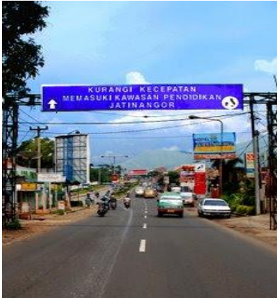
Gambar 4.1 Gerbang masuk kawasan pendidikan Jatinangor

Saat ini Jatinangor dikenal sebagai salah satu kawasan pendidikan tinggi terkemuka di Indonesia. Perguruan tinggi yang berada di kawasan Jatinangor yaitu :