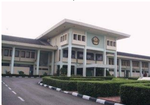
Gambar 4.2 Kampus UNPAD

Universitas Padjajaran pertama didirikan di Bandung. Letak kampus di Bandung tersebar pada 13 lokasi yang berbeda. Hal ini mengakibatkan sulitnya