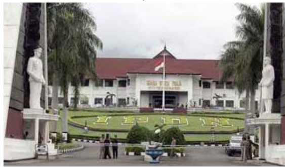
Gambar 4.3 Kampus IPDN

Pendirian IPDN yang dahulu bernama APDN di Jatinangor dimulai pada Tahun 1988. Hal ini berdasarkan pertimbangan untuk menjamin terbentuknya wawasan nasional dan pengendalian kualitas pendidikan. Melalui Keputusan Menteri Dalam Negeri Nomor. 38 Tahun 1988 tentang Pembentukan Akademi Pemerintahan Dalam Negeri Nasional.( APDN Nasional) kedua dengan program D III ditetapkan pendirian kampus di Jatinangor , Sumedang Jawa Barat. Peresmian kampus tersebut dilakukan oleh Mendagri pada tanggal 18 Agustus 1990. (sumber: http://www.ipdn.ac.id )