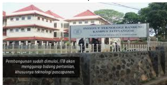
Gambar 4.5 Kampus ITB

Untuk mencapai visi misinya maka ITB perlu melakukan pengembangan kampus di luar wilayah Bandung. Oleh karena itu pada tanggal 31 Desember 2010 dilakukan penandatanganan perjanjian kerjasama ITB dengan Pemerintah Propinsi Jawa Barat Nomor: 073/02/otdaksm/2010, untuk pengelolaan lahan pendidikan yang terletak di Jatiningor dan di Tanjungsari, Kabupaten Sumedang. Selain sesuai dengan landasan pengembangan ITB, pengembangan ITB Jatiningor dilatarbelakangi oleh: