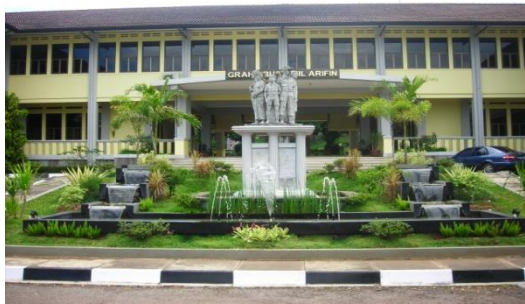
Gambar 4.4 Kampus IKOPIN

Institut Manajemen Koperasi Indonesia (Ikopin) berdiri secara resmi pada tanggal 7 Mei 1982 bertepatan dengan keluarnya ijin operasional dari Kopertis Wilayah IV Jawa Barat. Ikopin didirikan dan dibina oleh Yayasan Badan Pembina Pendidikan dan Penelitian Perkoperasian (Yayasan BP-4). Saat ini yayasan tersebut berubah namanya menjadi Yayasan Pendidikan Koperasi (YPK). Pada tahun 1984 Ikopin memperoleh status Terdaftar berdasarkan Surat Keputusan Mendikbud No. 133/1984. Kampus Ikopin di Jatiningor Kabupaten Sumedang diresmikan oleh Presiden Republik Indonesia pada tanggal 12 Juli 1984.